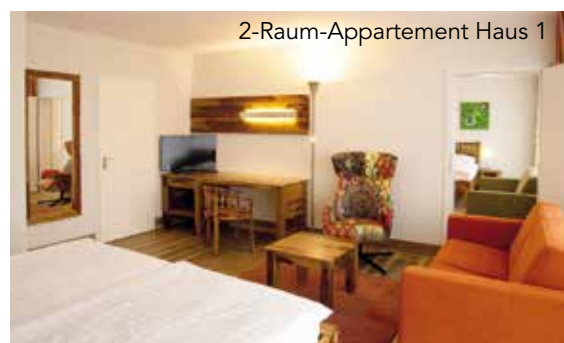
2-Raum-Appartement Haus 1