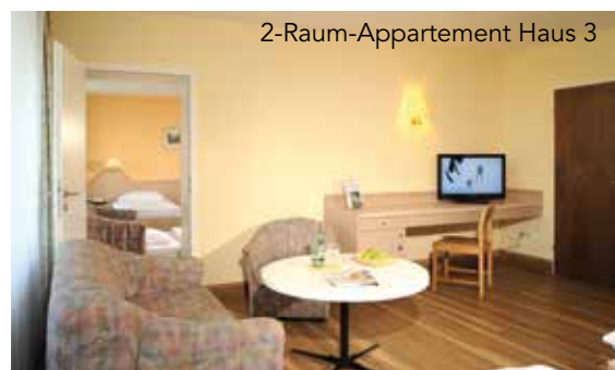
2-Raum-Appartement Haus 3