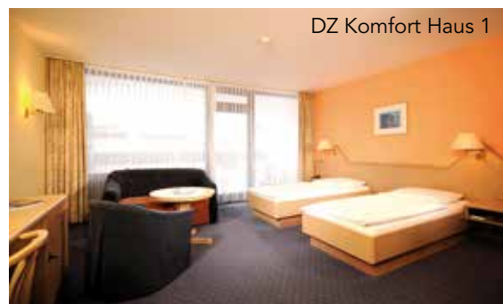
DZ Komfort Haus 1

Für Kinder bis 2 Jahre stellen wir gerne ein Babybett, Windeleimer und Wickelaufgabe im Zimmer bereit (im Kinderpreis inklusive). Bitte melden Sie dies im Vorfeld an. Allergikerzimmer und Zimmer mit Dusche anstelle Badewanne sind auf Anfrage und nach Verfügbarkeit in einzelnen Kategorien buchbar, ebenso Zimmer, welche mit Hund bezogen werden können.