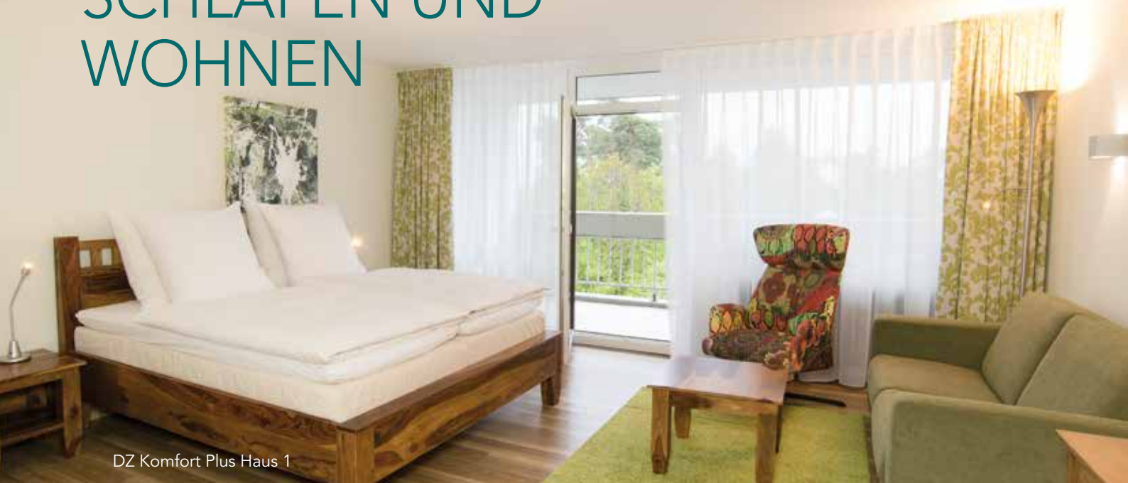
DZ Komfort Plus Haus 1

Die 380 Hotelzimmer sind auf drei miteinander verbundene Gebäude verteilt. Die Häuser 2 und 3 sind über den Bürgersteig oder über den Verbindungsgang im Inneren (mit Stufen und Brandschutztüren) vom Haupthaus aus erreichbar.